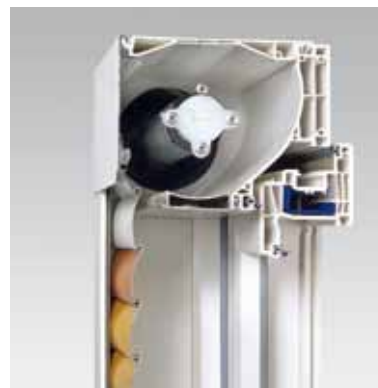
Corona S Integra