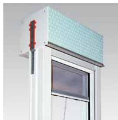
RollTop, raumseitig geschlossen, mit Insektenschutzrollo