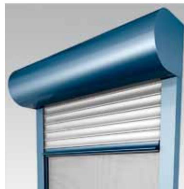
FrontTop mit integriertem Insektenschutzrollo